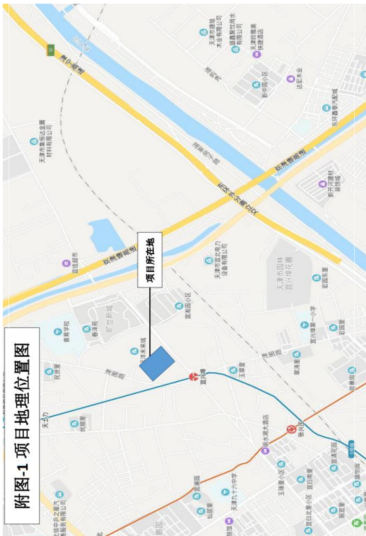
附图 1. 项目区地理位置图