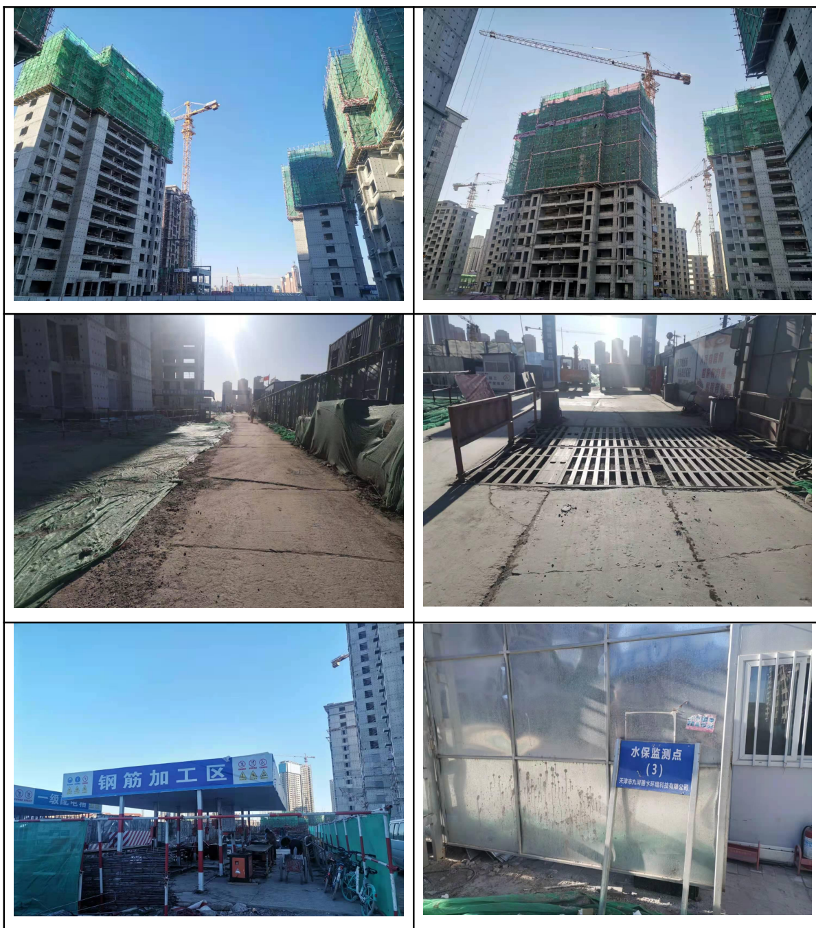
图 1-1 工程现状